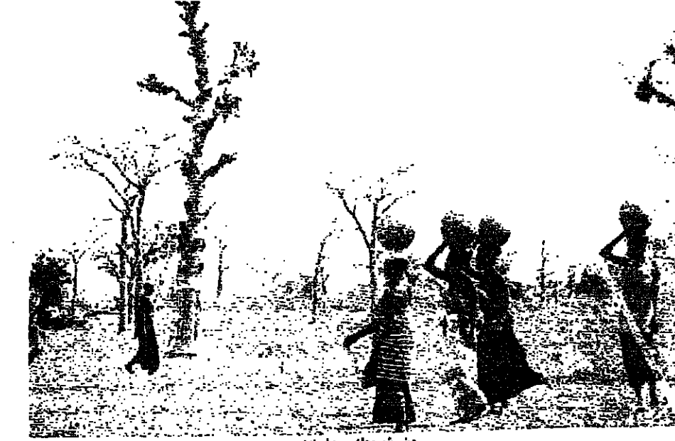
من شريطه «يا انا»